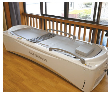
ベッド型マッサージ器