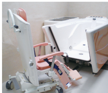
特殊浴槽 (チェアインバス) ※リフト浴もあります。

ご希望に沿った介護サービスもお受けいただけるよう、併設のデイサービスとも連携をしております。