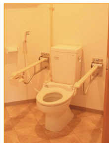
車イス対応のトイレ