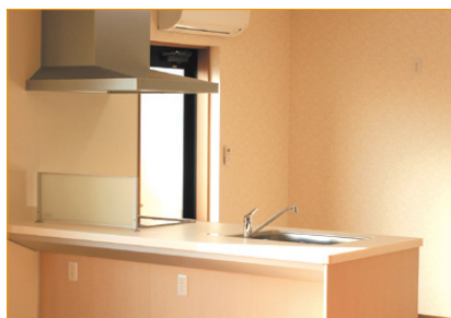
利用者様も使いやすいキッチン