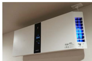
清潔な空気を保つプラズマクラスター