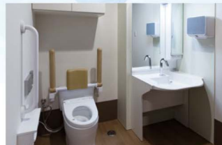
安全に配慮した水回り