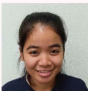
デイサービス 花音 テン スレイニアン (カンボジア)

【質問】①日本の好きなお店 ②日本で行ってみたい場所 ③好きな食べ物 ④休日の過ごし方 ⑤介護の仕事について