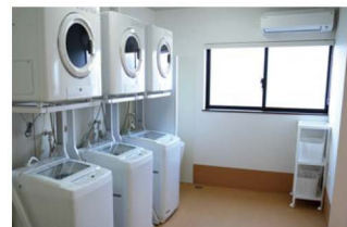
清潔感のあるランドリールーム