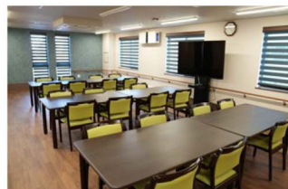
明るく開放的な食堂