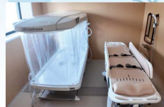
快適さと安全性に配慮した最新の入浴機器