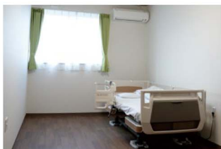
全30室見守りシステムを完備

看護師と介護スタッフが24時間常駐しており、個々の健康状態に応じたサポートを行います。